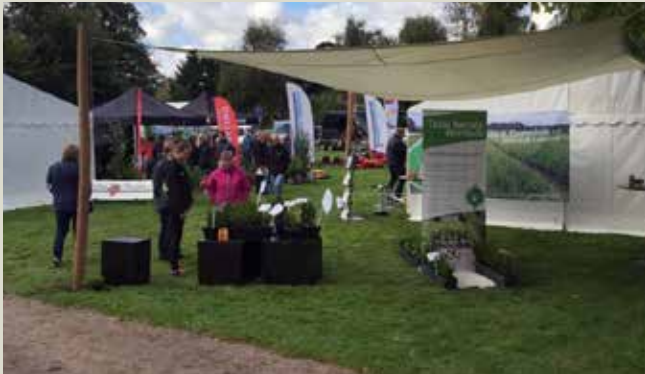
I 2016 var der 60 udstillere ved Kirke og kirkegårds messen på Mors.