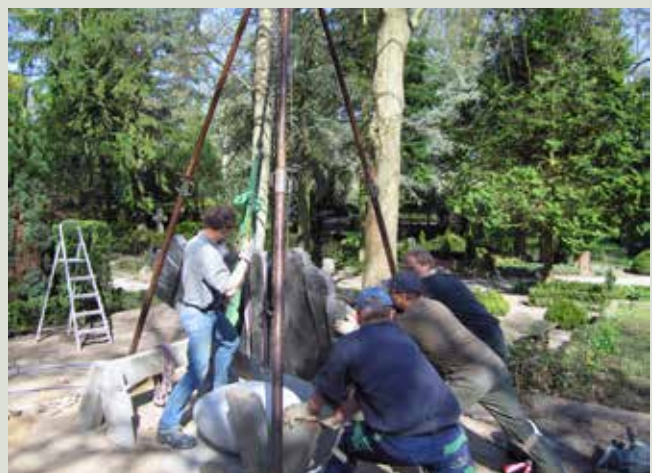
Billedserien fortæller om processen med opsætning af skulpturen og anlægget af pladsen rundt om.