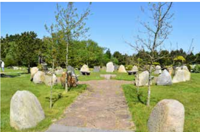
Midt på kirkegården ligger en cirkelformet mindelund, der er tilegnet omkomne søfolk.