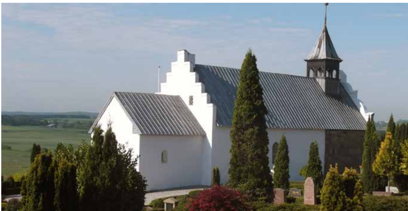
Viring Kirke menes at være opført omkring år 1070 og er dermed en af Danmarks ældste landsbykirker. Viring Sogn hører under Randers Søndre Provsti og rummer godt 1.000 indbyggere.

Jeg vil gerne komme med en opfordring til mine kollegaer ude på de små kirkegårde rundt omkring i landet, omkring brug af kirkebilsordninger. Jeg tænker at de fleste menighedsråd stiller kirkebil til rådighed for menigheden, således at de kan komme til gudstjeneste i sognet, selvom de er svagt gående eller ikke selv kan køre til kirken/gudstjenesten, og offentlig transport ikke er en mulighed.