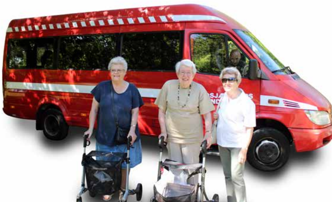
De ældre nyder muligheden for at kunne komme på kirkegården og det at køre sammen i minibussen, giver dem også noget socialt.

Kørselsordningen koster kirkegården ca. 9.000 kr. pr. år, men vi føler at pengene er givet godt ud. Vi kan mærke på de ældre, at de nyder muligheden for at kunne komme på kirkegården, og samtidig giver det dem noget socialt, ved at få kontakten med andre ældre. ■