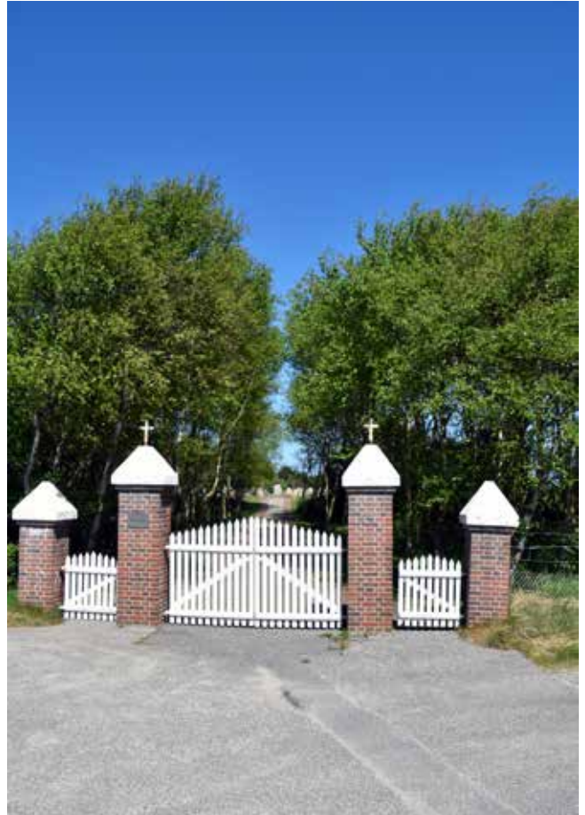
Indgangspartiet på Sønderho Ny Kirkegård afspejler den lokale byggestil.

Julius Bomholts er begravet her, og hans grav kan stadig ses på kirkegården.