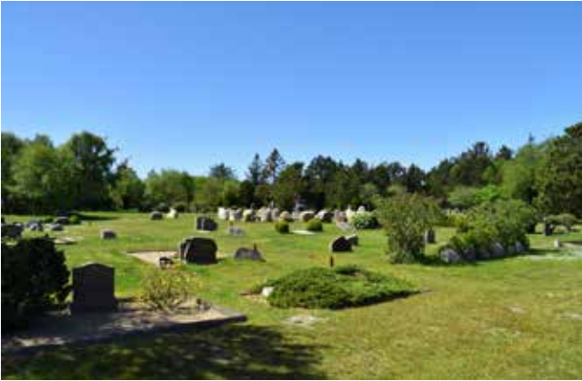
Der er hverken hække eller perlestensbelagte stier på Kirkegården.