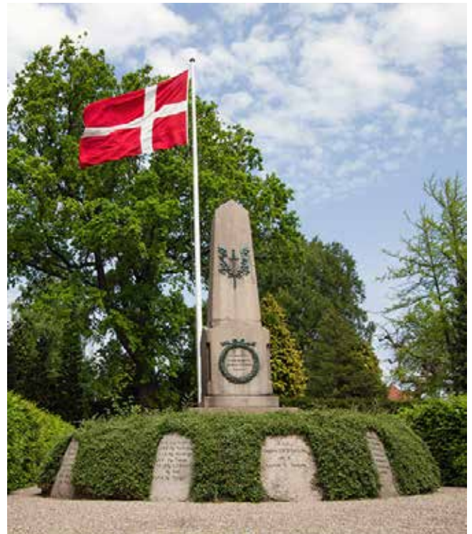
Krigergraven på Nordre Kirkegård er for de faldne soldater fra de slesvigske krige i 1848-50 og 1864.