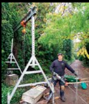
Nykøbing Falster 2017